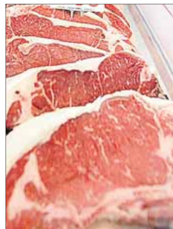
Crece la venta de carne.

RÉCORD. En cuanto al ritmo de ventas en el arranque del año, Falero dijo que hay un panorama dispar de acuerdo al poder adquisitivo de la zona. Los barrios de mejor poder adquisitivo cayeron cerca de 50% la venta como consecuencia del éxodo hacia lugares turísticos, mientras que en los barrios periféricos el consumo se mantu-